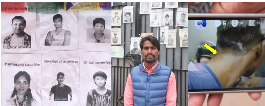
19歳の女子学生や13歳の生徒も射殺された。

3月9日、国会議事堂の正門前、私がこの写真を撮っていると一人の青年が話しかけてくれました。「自分もこの時ここにおいて、首の後ろを銃弾で負傷した。あと5センチ上だと命がなかった。昨日、3月8日は、昨年9月8日、ここで19人の若者たちが命を失ってから6か月目。ここで追悼集会が開かれた」と。